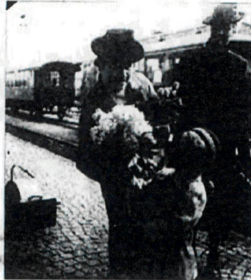
En danska blomsterhyllas på stationen i Halmstad av en mycket ung gentleman.