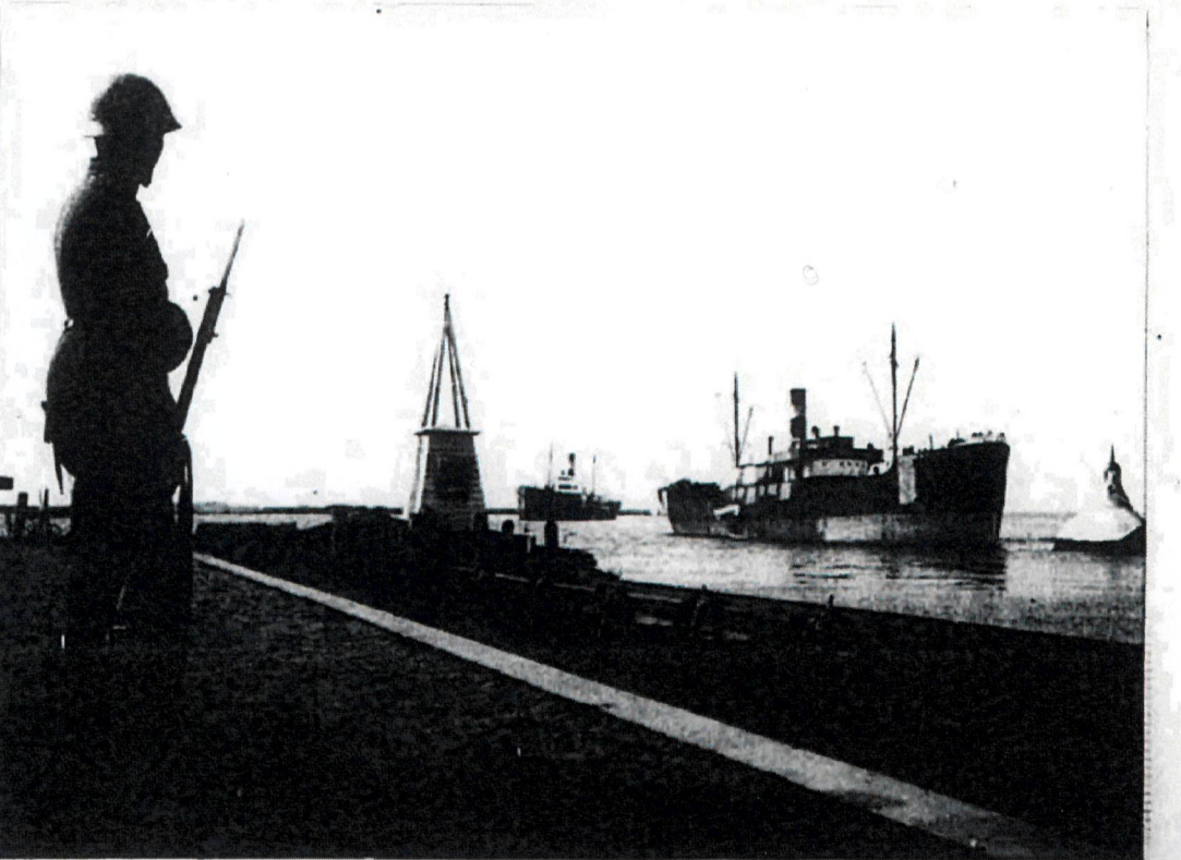
Bilden av krigets Halmstad - en soldat på vakt i hamnen under det sista krigsret.