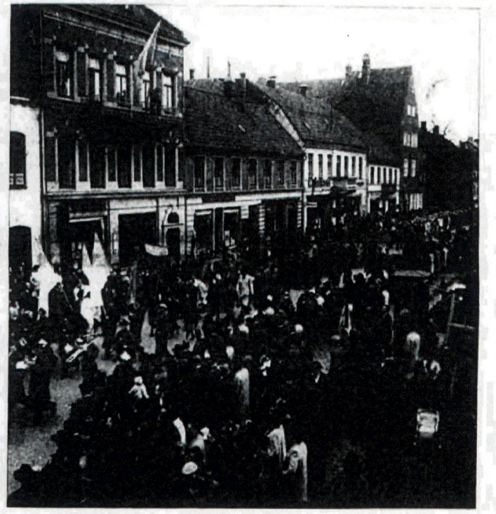
Äntligen fred. Halmstadborna lågar genom stan för att fira att andra världskriget tagit slut.