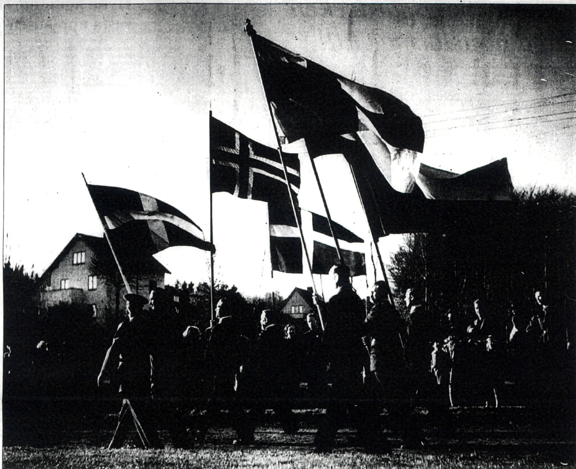
Med nordiska fanor i spetsen marscherar man in på Örjans vall för att fira fredsdagen.