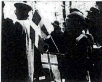
Det syntes både danska, svenska och norska flaggor i demonstrationståget.