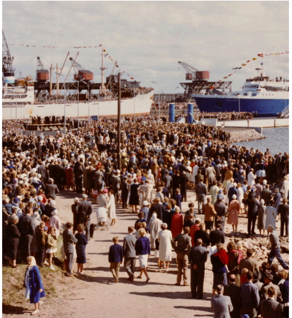
Premiär för Prins Bertil 1960.