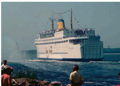
Året är 1988, och det är premiär för Lion Queen.

Många Halmstadbor talade om att göra dagresor med Stena Nautica. Lastbilstransporterna var mer omfattande än någonsin. Nu kunde det väl inte misslyckas? Strax efter att Stena Nautica lade till i Halmstad bröt covid ut i Sverige. Långt in på våren 2020 stod länderna Sverige och Danmark nästan stilla. Detsamma gällde vintern 2021. Halmstadlinjen fick på