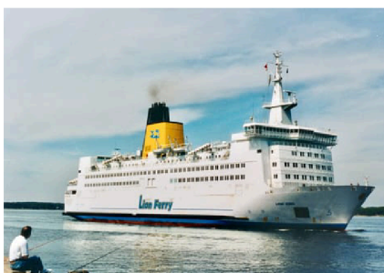
Lion King 1995.