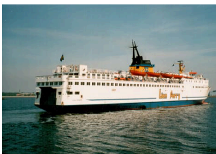
Här är det Lion Prince som anlöper Halmstad.