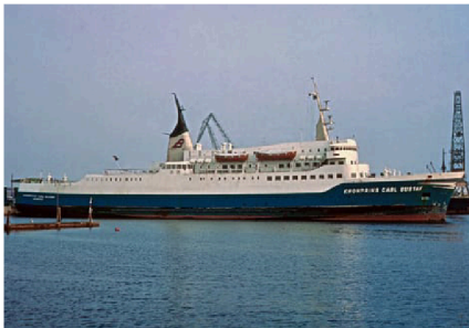
För 60 år sedan, i maj 1966, sattes Kronprins Carl Gustaf in på linjen Halmstad-Köpenhamn-Travemünde.