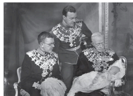
Fyra generationer tronföljare samlade: kronprins Gustaf Adolf, prins Gustaf Adolf och kung Gustaf V med prins Carl Gustaf i knät.

• För 37 år sedan , 1989, avled den italienska filmregissören Sergio Leone , 60 år gammal. Han är känd som den främsta regissören av "spagettivästern" och har gjort flera klassiker tillsammans med skådespelaren Clint Eastwood , som "För en handfull dollar" (1964), "För några dollar mer" (1965) och "Den gode, den onde, den fula" (1966).