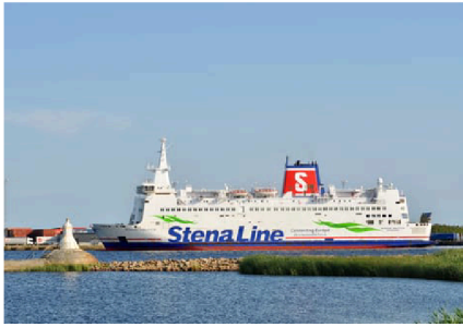
Den ombyggda Stena Nautica (bild från 2020).