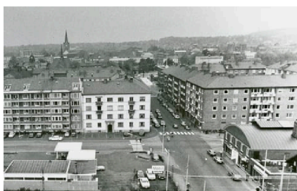
Byggnationen på Fredsgatan är generellt ganska hög och ger karaktären av en stor stad.