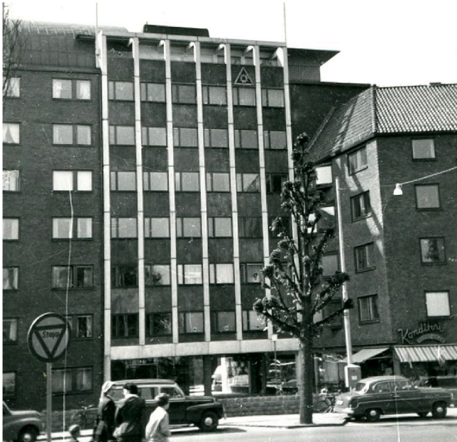
Temperridarhuset stod klart 1958.