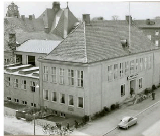
Stadsbiblioteket (i dag Noll-tre-fem) stod klart 1953, men ritades tio år tidigare av Fredrik Wetterqvist.