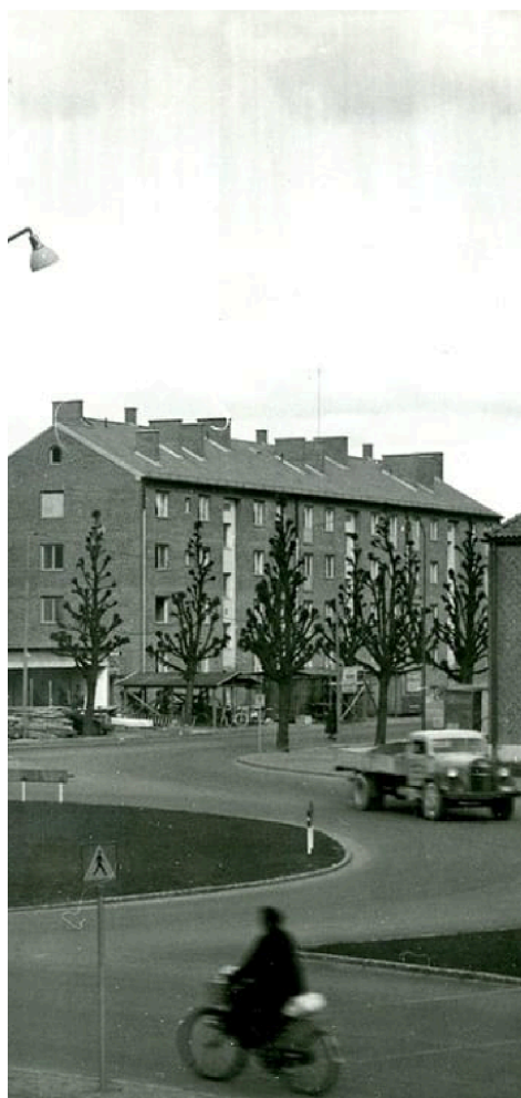
oss i USA. Huset var ju så högt!