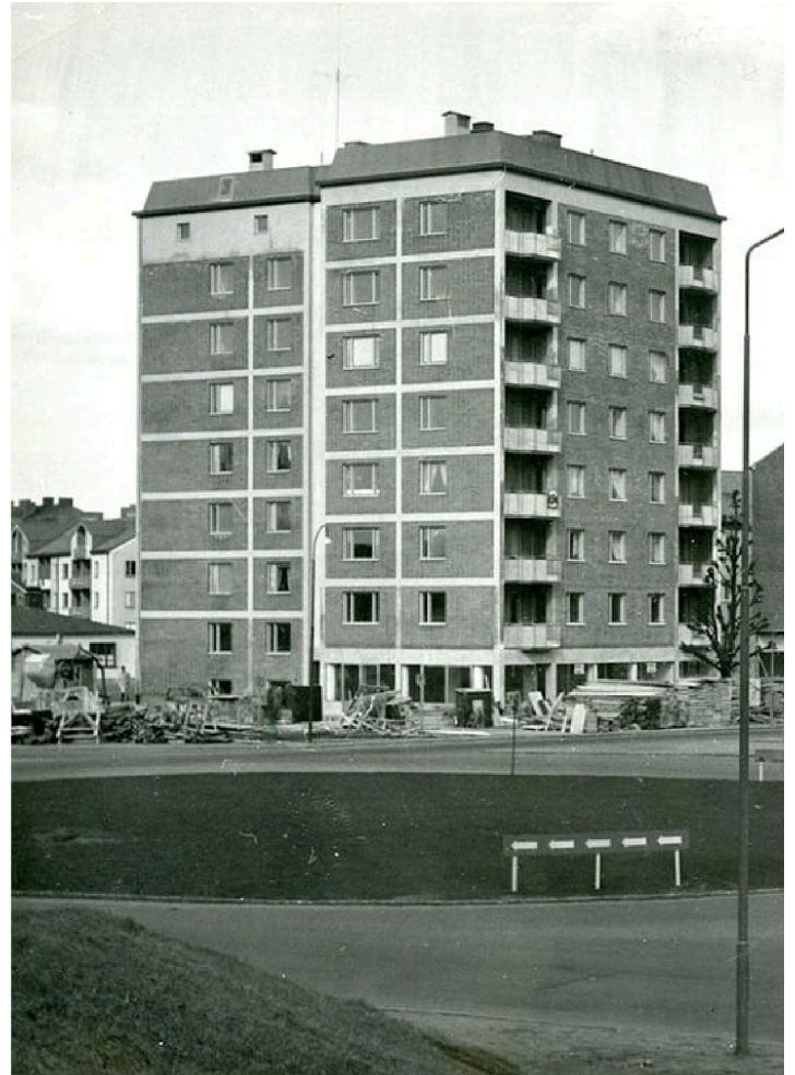
"Naturligtvis dominerar höghuset vid rondellen som när det byggdes gav oss barn en känsla av att befinna