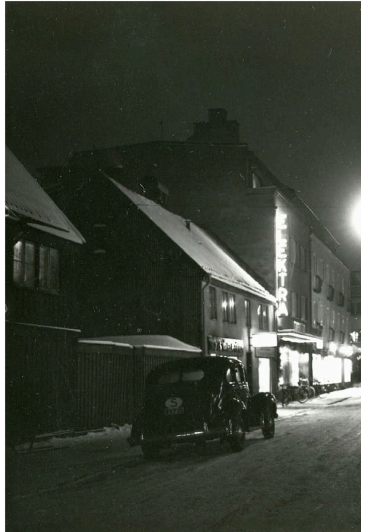
Julfirandet 1938 är stillsamt. Många Halmstadbor känner att de lever i en mörk tid – och snart är det