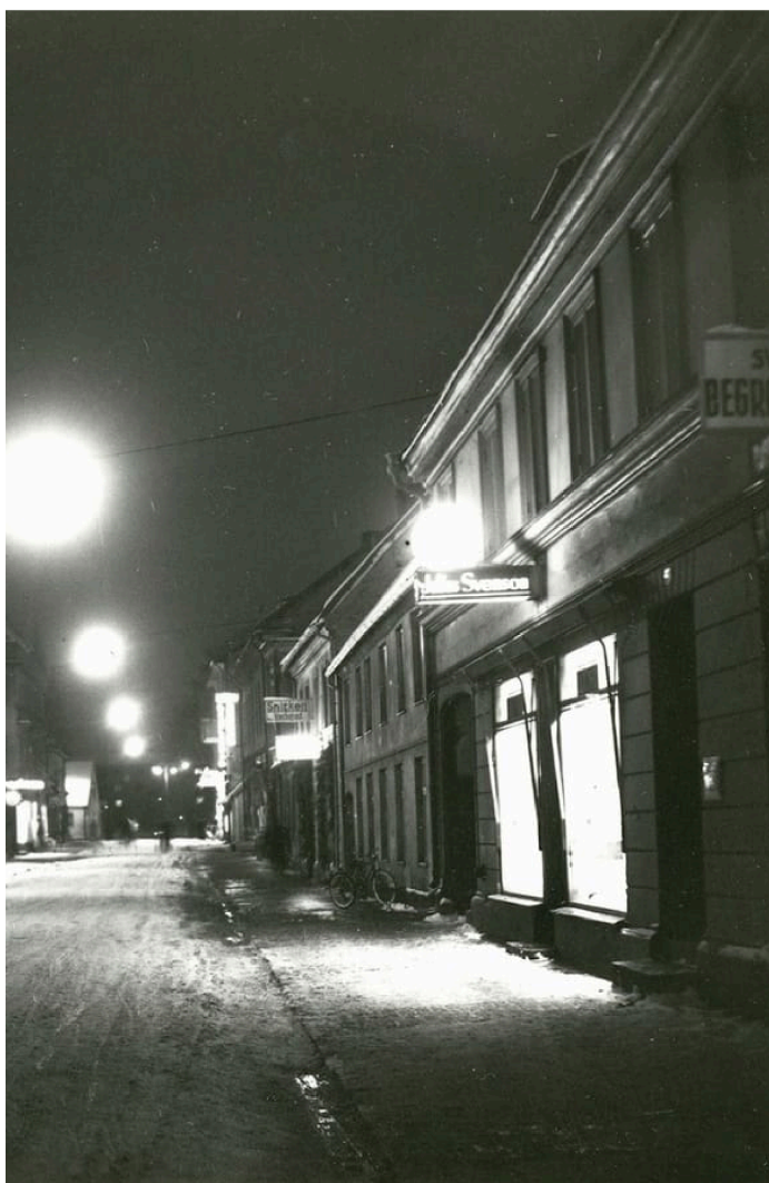
andra världskriget ett faktum.