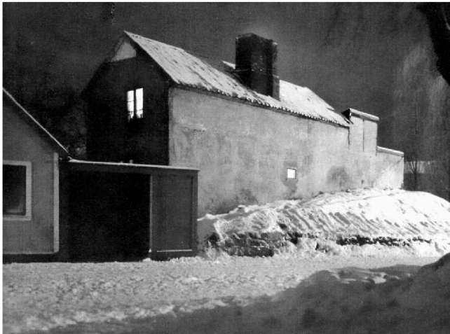
Lugnet före stormen (inför nyår drar ännu en snöstorm in och lamslår trafiken...).