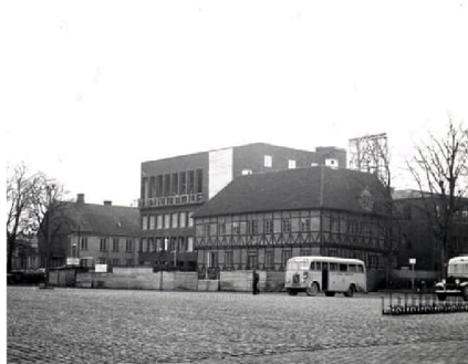
Halmstad och Stora torg i slutet av 1930-talet.