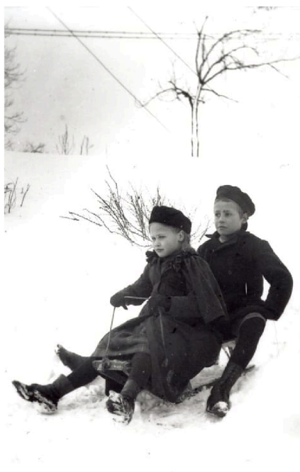
Det blir en vacker, vit jul i Halmstad, och stadens barn passar på att åka pulka.