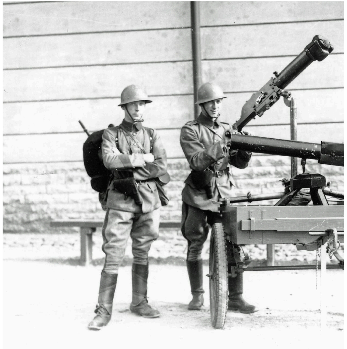
Halmstads stadsbild förändrades under andra världskriget, och bland annat sattes luftbevakningstorn upp. På bilden syns en luftvärnspruta.